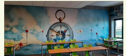
Het kompas bij aardrijkskunde