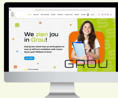
De nieuwe website van Sevenwolden Grou

En dan nog een stapje in de ontwikkeling. We hebben een mooie nieuwe website met veel praktische informatie waar ook u wat aan kunt hebben. De website wordt de komende tijd verder gevuld.