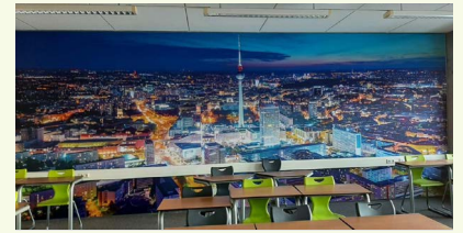
Berlijn bij nacht

Wat we vanuit deze werkgroep ook onder de loep hebben genomen is "de manier waarop we op school de dingen doen". Hoe hebben wij praktisch gezien de dingen geregeld? Als nieuwe collega was ik niet alleen benieuwd naar wat er al afgesproken was, maar ook of dat nog voor iedereen duidelijk was en of er behoefte was aan het veranderen van onze aanpak. Intern hebben we daarover gesprekken gevoerd. Op de website zullen we "onze manieren" voor het nieuwe schooljaar publiceren. U zult zien dat we niet veel veranderd hebben. Hier en daar zullen misschien wat accenten verlegd zijn. De opbrengst van het proces zat 'm vooral in het feit dat we alles weer eens opgepoetst hebben en door duidelijkheid eenduidiger kunnen werken. Een voorbeeld daarvan dat we met elkaar hebben afgesproken dat alle toetsen voortaan in Somtoday staan en niet meer in de learning portal.